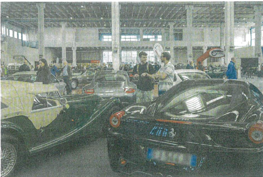
Il pubblico. Un momento dall'edizione dello scorso anno